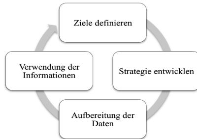
Abbildung 2: Social Media Monitoring-Zyklus

und Bannour 2011, S. 101). Infolgedessen sollte das Social Media Monitoring als fortlaufender Prozess mit in die Unternehmensstrategie aufgenommen werden. Aus einer solch kontinuierlichen Durchführung entsteht ein Social Media Monitoring-Zyklus (Abbildung 2).